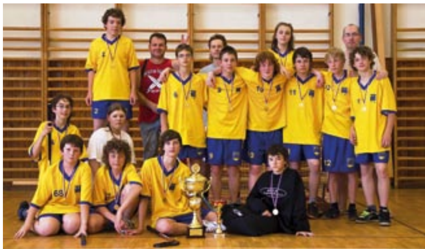
Vítězství ve florbalovém turnaji