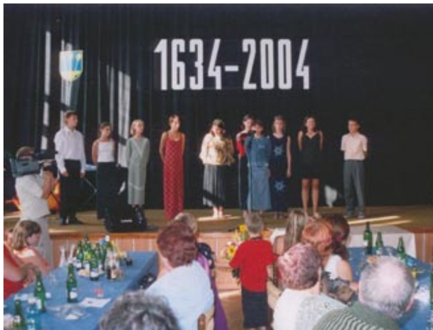
Výročí založení obce