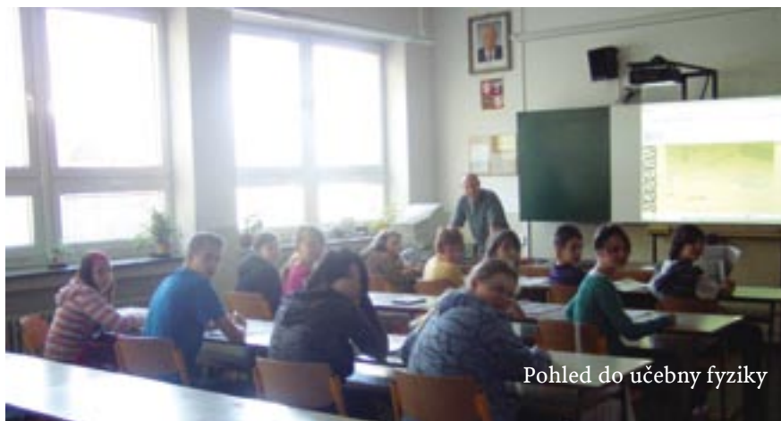
Pohled do učebny fyziky