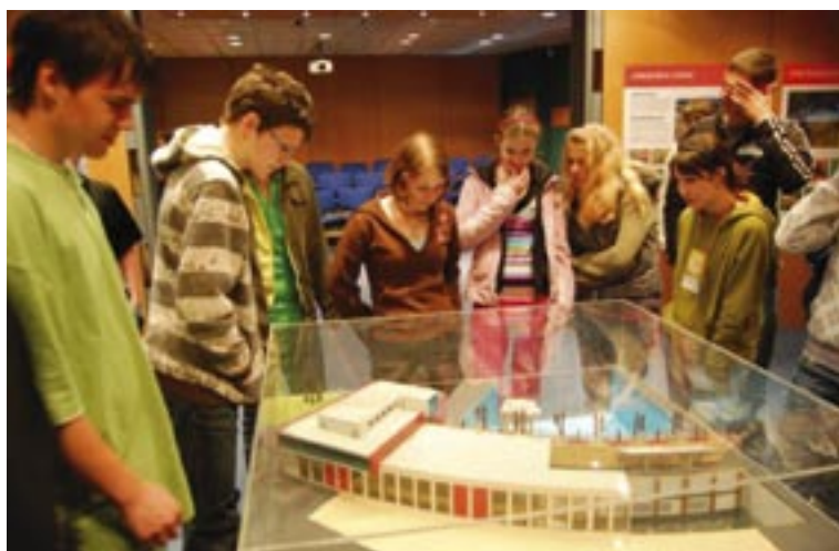
Exkurze do Dukovan