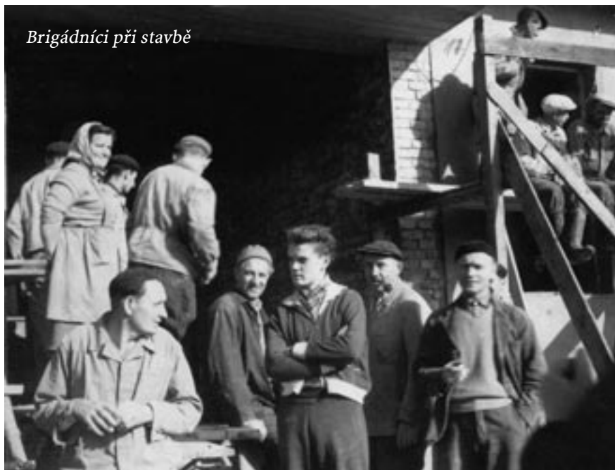
Brigádníci při stavbě