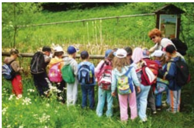
Škola v přírodě