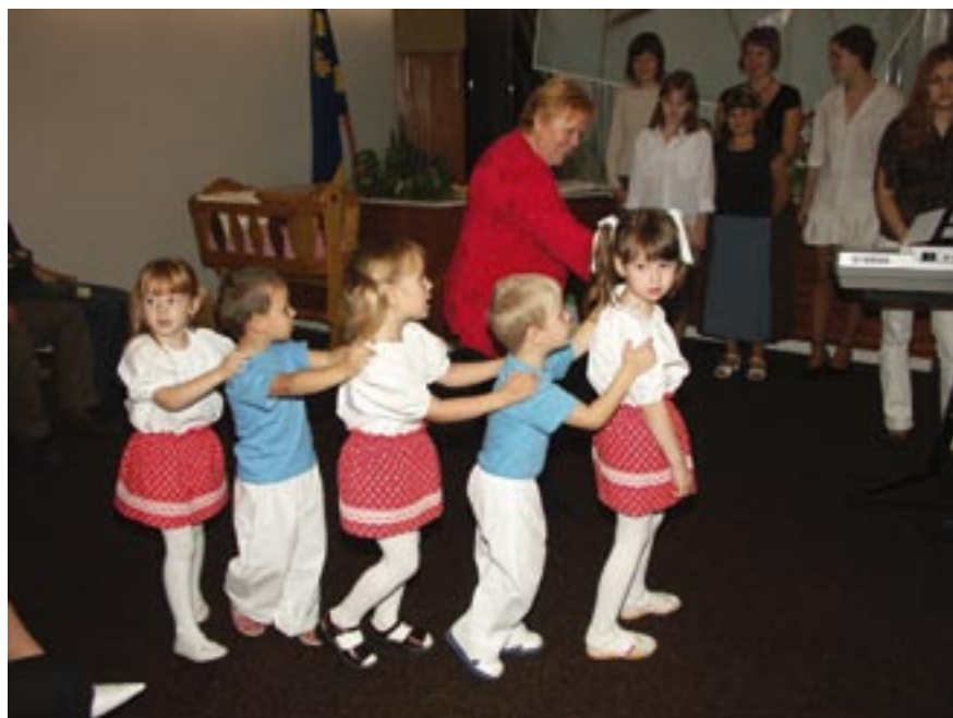
Vítání nových občánek