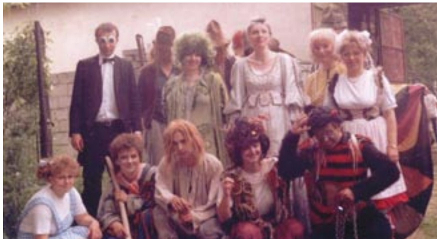
Výlet do pohádky