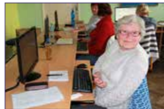
Práce na PC v ZŠ