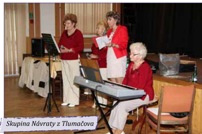
Skupina Návraty z Tlumačova