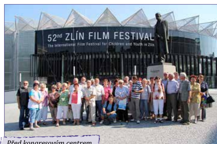
Před kongresovým centrem