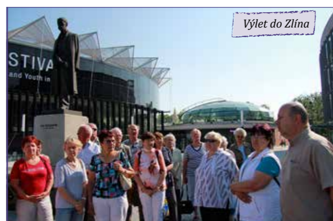
Výlet do Zlína