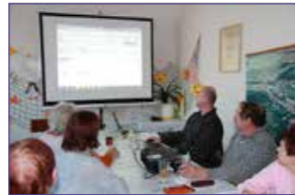
Práce s internetem