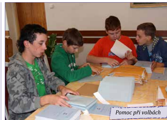
Pomoc při volbách