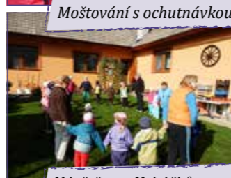
Návštěva u Hrbáčků