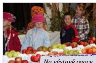
Na výstavě ovoce