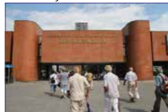
Obuvnické muzeum Zlín