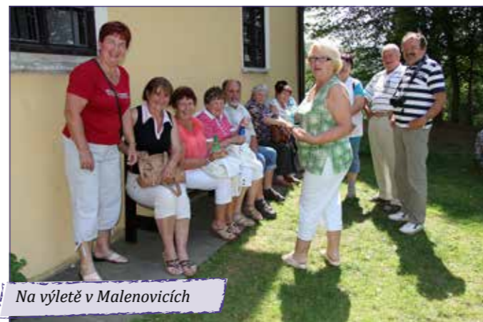
Na výletě v Malenovicích