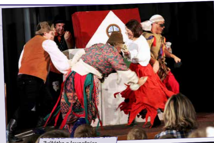
Zvířátka a loupežnice