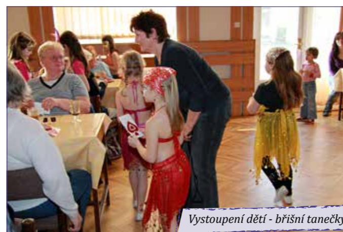
Vystoupení dětí - bříšní tanečky