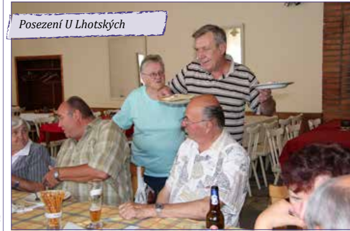
Posezení U Lhotských