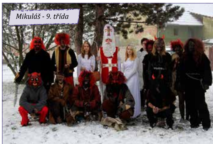
Mikuláš - 9. třída

První Mikuláš s čerty a anděly se objevil už na rozsvěcování vánočního stromu v sobotu 1. prosince. Ve středu 5. prosince si jako tradičně užili svého Mikuláše žáci 9. ročníku. Tlupa čertů dva andělé a Mikuláš postupně prošli třídy v mateřské škole a všechny ročníky základní školy. Nezapomněli ani na kuchařky zdejší jídelny a navštívili i pracovníky obecního úřadu. Další Mikuláš se objevil na Mikuláš-