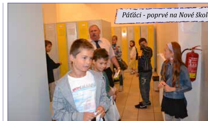
Pátáci - poprvé na Nové škole