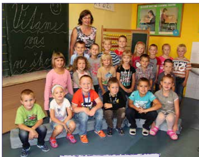
Slavnostní zahájení - Prvňáčci