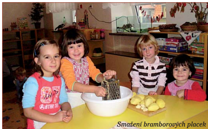
Smažení bramborových placek