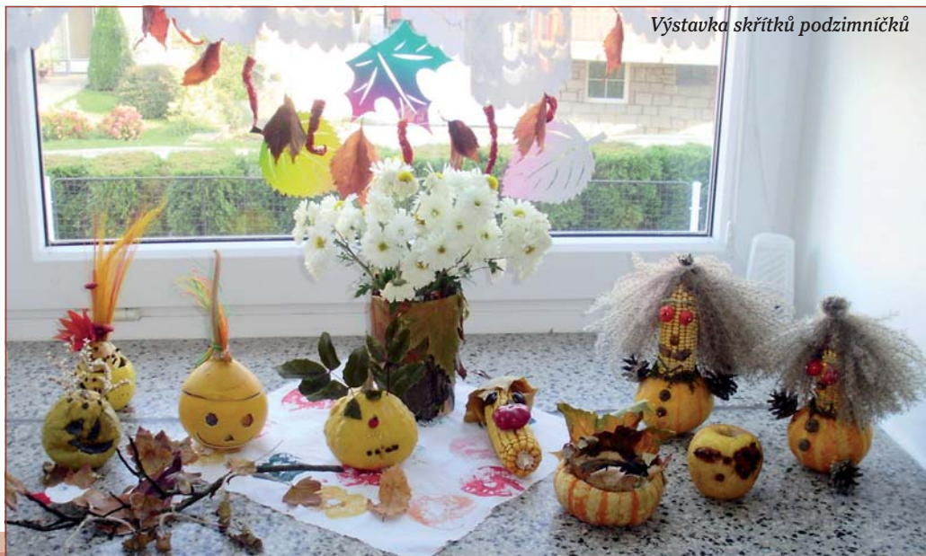
Výstava skřítků podzimníchků