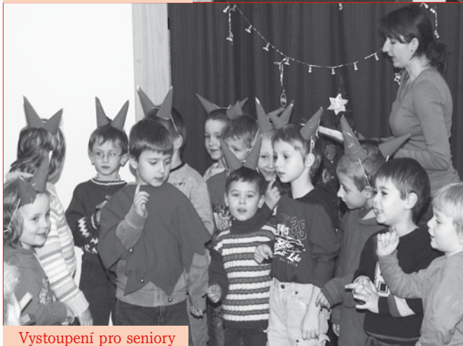
Vystoupení pro seniory