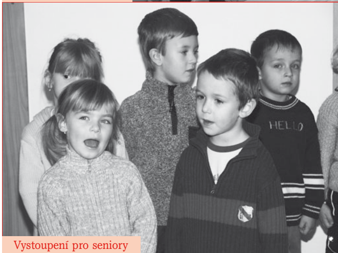
Vystoupení pro seniory