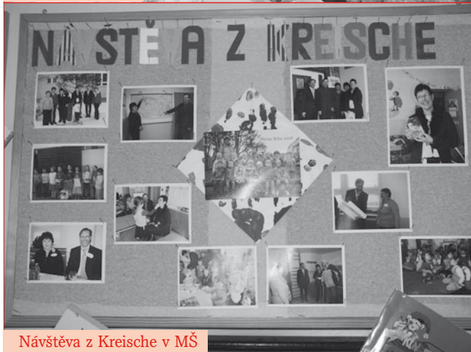
Návštěva z Kreische v MŠ