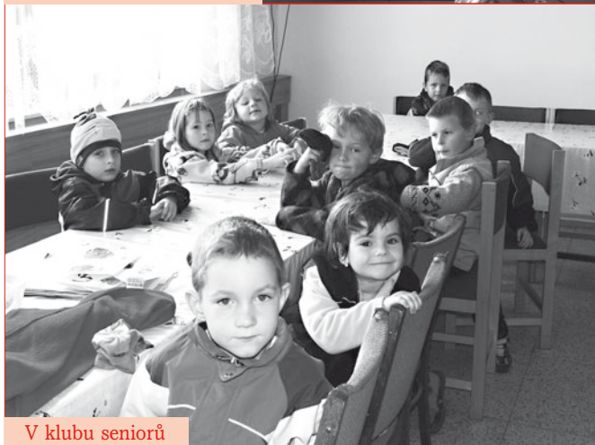
V klubu seniorů