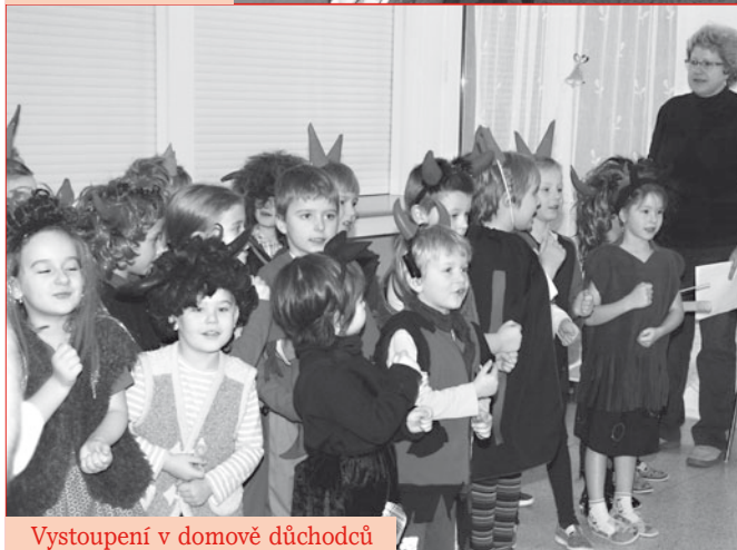
Vystoupení v domově důchodců