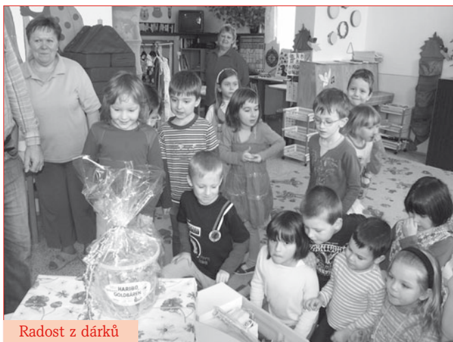
Radost z dárků