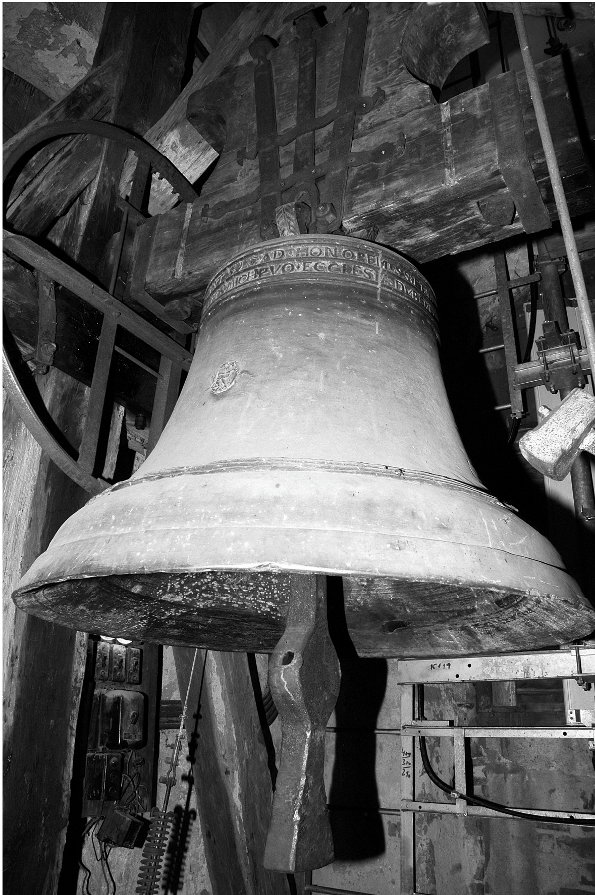
Obr. č. 2: celkový pohled na zvon z roku 1622